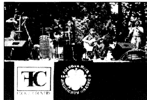
Spolektiv na Folkové růži

Na jistou hranici jsme ale narazili. Splaskla nám vytrvalost a vyšuměla vlastnost dokázat znovu naskočit do rozjetého vlaku. A pak se také z části projevila nervozita pár členů kapely při tom hledání nových a dalších projevů. Někdy taky nevyšla zkouška. Že někdy nevíš, jak do toho, je normální a běžný jev. Znáš to, jsou to tvůrčí muka... Jenomže, Spolektiv byla skupina založená hlavně na vzájemných vztazích a rovnosti. Chtělo to ostrou autoritu aspoň jednoho z nás. Možná jsem to měl být já, ale necítil jsem to tak.